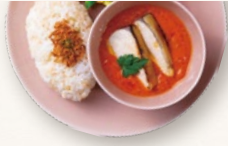
フィッシュカレー